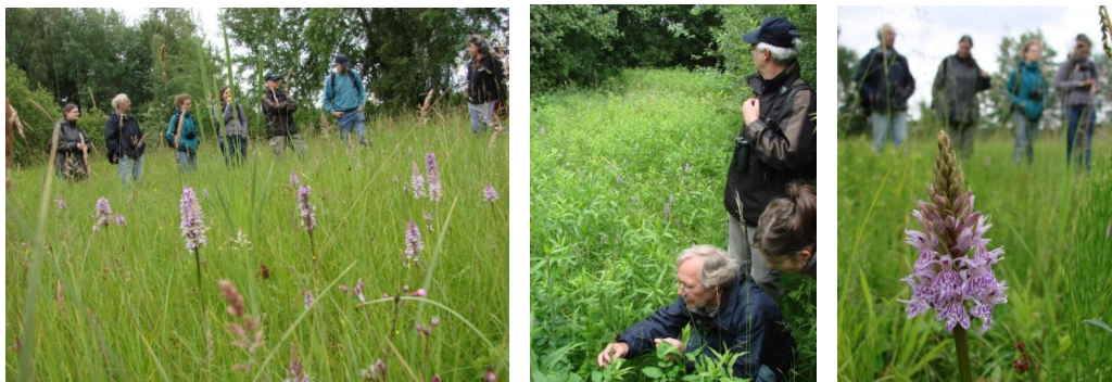
Lagebesprechung und Zählappell: wie viele Blütenstände sind zu sehen?

... am 16. Mai 2015 mit 8 ZählerInnen in 2 Gruppen die diesjährigen besetzten Reiherhorste im Heeperholz erfasst. Trotz einiger Sturmschäden, bei denen diverse Horste abgestürzt sind und ein Horstbaum umgeworfen wurde, hat sich der Gesamtbestand mit mind. 23 besetzten Horsten erfreulicherweise kaum verändert. Allerdings hat sich der Koloniekern weiter von seinem ursprünglichen Standort wegverlagert, etliche Horste sind jetzt ziemlich verstreut und schwer zu erfassen. Der Ansiedlungsversuch direkt am Meierteich wurde eingestellt. Bleibt zu hoffen, dass die neuen Koloniebereiche lange und ungestört fortbestehen können! (siehe auch unseren Aktionstag am 17.1.2015)