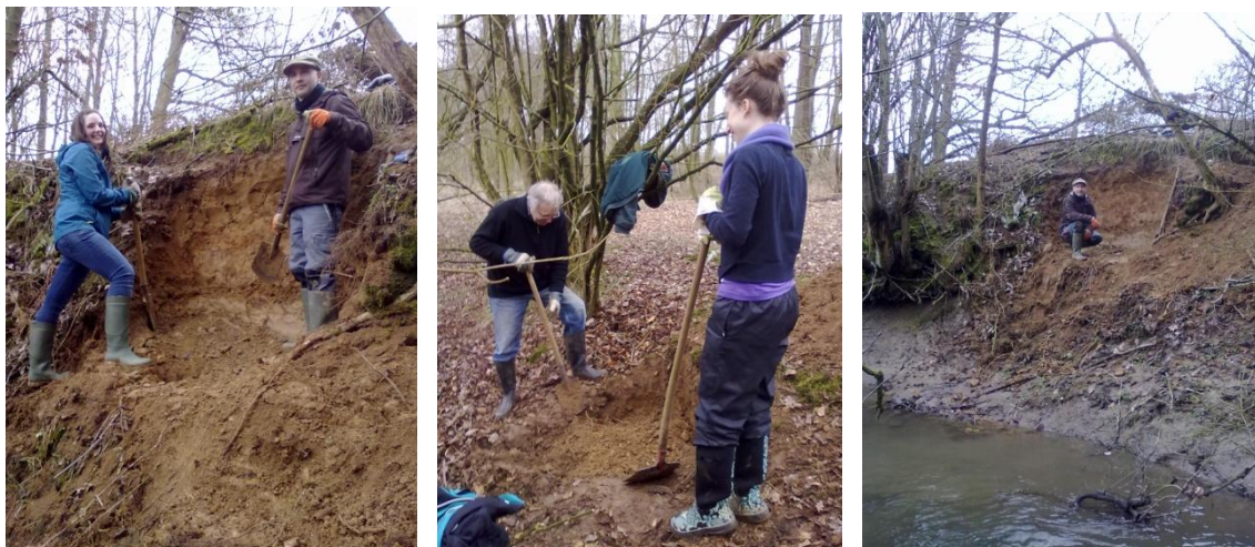
Unser neues Immobilienangebot für Eisvögel ist erstbezugsfertig: hochwassersicher (hoffentlich!), preisgünstig und mit fließendem Wasser.

Aber die erste Wand ist schön geworden, die zweite wollen wir beim nächsten Termin abschließen. Dann haben die Vögel Wechselmöglichkeiten für ihre beliebten Schachtelbruten. Hoffentlich spricht sich das neue Angebot unter den Eisvögeln bald herum!