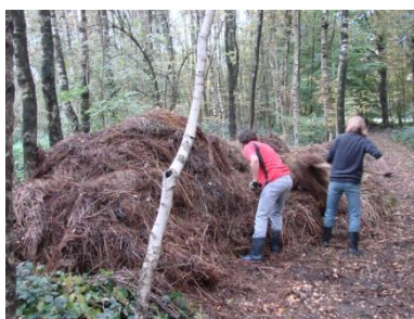
Ein Teil unserer „Ernte“