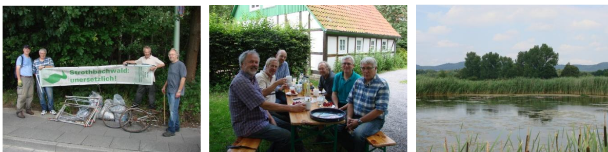
Den Strothbachwald behalten wir im Auge – und stärken uns nach der „Waldarbeit“. Die Bergung der Brutflöße muss dagegen noch bis Herbst warten ...

Zur Belohnung gab es anschließend Geburtstagskuchen in den Rieselfeldern unter der Begleitmusik von rastenden Kiebitzen. Die Lachmöwen und ihr Nachwuchs hatten ihre Brutflöße und das Reservat bereits geräumt. Übrig geblieben war lediglich ein Graugansgelege auf einem der Flöße – ob daraus wohl noch Nachzügler schlüpfen? Im Herbst beim Einholen der Flöße werden wir mehr erfahren!