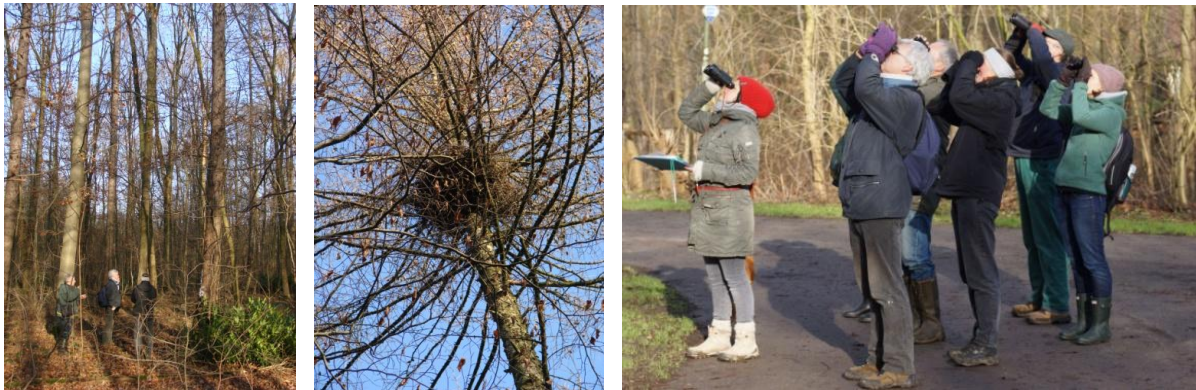
Markierung und Einmessung einer Lärche mit dem Großhorst eines Greifvogels im Heeperholz - und reichlich Luftküsse!

... am 17. Januar 2015 im Heeperholz weitere Horste gesucht, die Horstbäume gekennzeichnet, mit GPS verortet, bestimmt, gemessen und registriert. Wir möchten damit einen Beitrag dazu leisten, dass der städtische Umweltbetrieb Forsten diese Bäume soweit wie möglich bei der Forstbewirtschaftung schonen und erhalten kann. Die Graureiherkolonie hat sich inzwischen so weit über das Heeperholz verteilt, dass es schwierig ist, alle Horste zu finden, zumal sie in den hohen Fichtenkronen ohnehin schwer erkennbar sind und nur in der Brutzeit infolge der Nutzungsspuren am Waldboden eindeutig geortet werden können. Jetzt im Winter sind wenigstens die Horste in den Laubbäumen sehr gut erkennbar, auch die großen Greifvogelhorste (z.B. von Mäusebussard, Habicht, Sperber). Schwieriger sind die mittelgroßen Horste der Rabenkrähen einzuordnen, die ja ab dem 2. Jahr gerne von Nachfolgern wie Turm- und Baumfalken oder Waldohreulen übernommen werden und daher ebenfalls geschont werden sollten. Weil diese Horste nicht sehr lange halten, haben wir ihre Bäume nur teilweise gekennzeichnet. Manchmal ist es auch knifflig, die Kobel der Eichhörnchen von Vogelhorsten zu unterscheiden. Aber wir üben fleißig weiter und wollen im Frühjahr auf der jetzt erarbeiteten Basis versuchen, auch die zugehörigen Brutpaare zu erfassen und zu identifizieren.