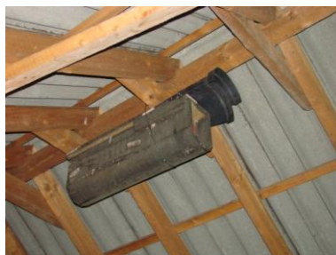
Ein ungewöhnlicher Platz für die Steinkauzröhre – aber den Versuch ist es wert!