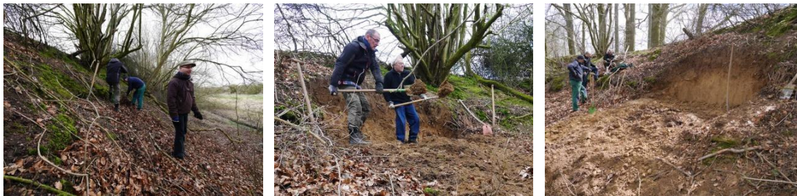
Hallo Eisvögel, antreten zum Ostereier-Wettlegen!