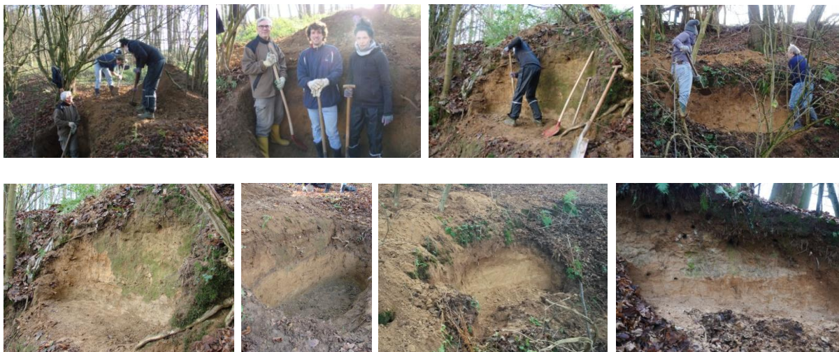
Muckibudenbesuch mit viel frischer Luft zugunsten des Eisvogel-Nachwuchses!