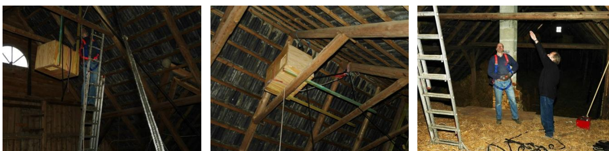
In schwindelnder Höhe und mardersicher entsteht eine neue Schleiereulen-Unterkunft. Hoffen wir, dass die in den letzten Jahren arg dezimierte Eulenpopulation wieder Tritt fasst!