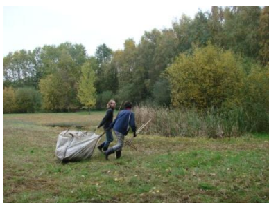
Der letzte Sack Grünschnitt!

... am 24. Oktober 2015 das restliche Mahdgut aus unserer Nasswiese in der Salzenteichsheid abgeräumt. Jetzt kann es im Laufe des Winters abgefahren werden. Als nächstes steht dort der weitere Rückschnitt von Gehölzen an!