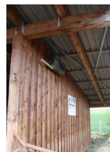
Gemischtes Programm: Bienenfleiß und Mittagspause im NABU-Garten, Steinkauzröhren bei den Heckrindern.