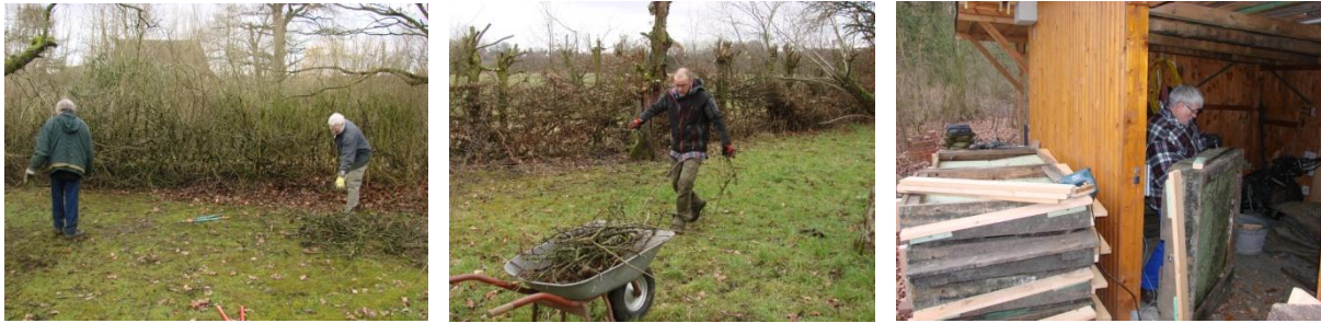
Mit Astschnitt werden unsere Hecken spatzengerecht möbliert, während nebenan schwimmende Kinderzimmer für Lachmöwen entstehen.

... am 17. Januar 2015 im Heeperholz weitere Horste gesucht, die Horstbäume gekennzeichnet, mit GPS verortet, bestimmt, gemessen und registriert. Wir möchten damit einen Beitrag dazu leisten, dass der städtische Umweltbetrieb Forsten diese Bäume soweit wie möglich bei der Forstbewirtschaftung schonen und erhalten kann. Die Graureiherkolonie hat sich inzwischen so weit über das Heeperholz verteilt, dass es schwierig ist, alle Horste zu finden, zumal sie in den hohen Fichtenkronen ohnehin schwer erkennbar sind und nur in der Brutzeit infolge der Nutzungsspuren am Waldboden eindeutig geortet werden können. Jetzt im Winter sind wenigstens die Horste in den Laubbäumen sehr gut erkennbar, auch die großen Greifvogelhorste (z.B. von Mäusebussard, Habicht, Sperber). Schwieriger sind die mittelgroßen Horste der Rabenkrähen einzuordnen, die ja ab dem 2. Jahr gerne von Nachfolgern wie Turm- und Baumfalken oder Waldohreulen übernommen werden und daher ebenfalls geschont werden sollten. Weil diese Horste nicht sehr lange halten, haben wir ihre Bäume nur teilweise gekennzeichnet. Manchmal ist es auch knifflig, die Kobel der Eichhörnchen von Vogelhorsten zu unterscheiden. Aber wir üben fleißig weiter und wollen im Frühjahr auf der jetzt erarbeiteten Basis versuchen, auch die zugehörigen Brutpaare zu erfassen und zu identifizieren.