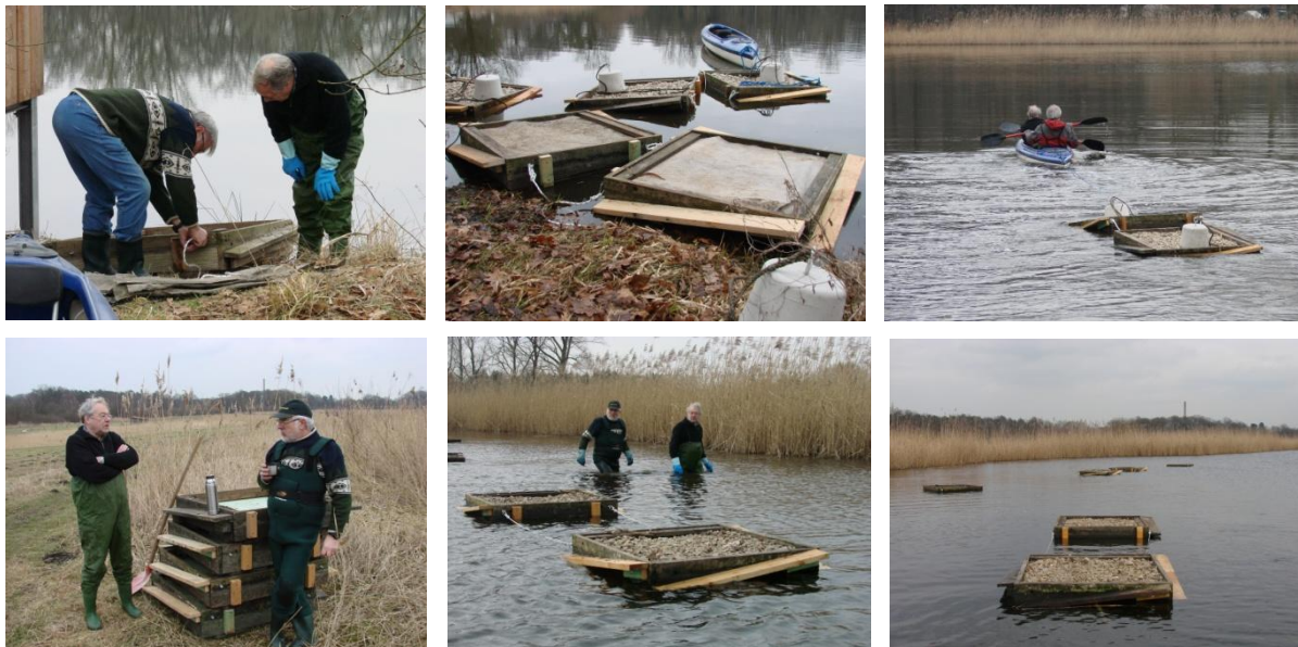
Im Schlepptau auf den Großen Teich und mit Wathose in die Schilfteiche: hier können Lachmöwen zukünftig sicher brüten.

schwimmen zu lassen. In kleineren Einheiten (Zweiergespanne) sollen sie nun die kleine Lachmöwenkolonie unterstützen, die sich im letzten Jahr auf den ersten Versuchsflößen angesiedelt hat. Im Großen Teich an der Niederheide im Blickfeld der neuen Aussichtsplattform liegen nun drei Doppelflöße und in zwei weiteren Teichen der Rieselfelder acht Doppel- und sieben Einzelflöße. Das Wetter spielte mit, so dass die feuchte Angelegenheit (hoffentlich) keine Erkältungen nach sich ziehen wird. Danke an Ingo und die Biostation für die freundliche Hilfe beim Transport!