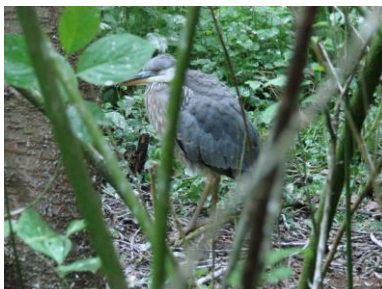
Einer der abgestürzten Horste und ein ebenfalls vorzeitig abgestürzter, fast flügger Jungreiher.