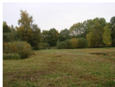
Der Winter kann kommen!

... am 17. Oktober 2015 das Mahdgut von unserer Nasswiese in der Salzenteichsheid (weitgehend) abgeräumt. Nasswiese war diesmal ganz wörtlich gemeint: tagelanger Regen und auch einiger Niederschlag heute haben die Wiese teilweise in eine Wasserlandschaft verwandelt: das war zwar sehr malerisch, erschwerte es aber auch, das nasse Gras zusammenzuharken und auf den Sammelplatz zu ziehen. Immerhin haben wir mit acht Malochern trotz des Wetterpechs das meiste geschafft, die von der Freien Scholle gesponserten Bigbags waren dabei wieder sehr nützlich. Etliche Grasfrösche freuten sich dagegen über das Wetter, die Mäuse wohl weniger, die wir aus ihren Heuhöhlen vertreiben mussten. Ein interessanter Fund war ein Zwergmausnest, eine kunstvoll geflochtene luftige Graskugel mit Seiteneingang.