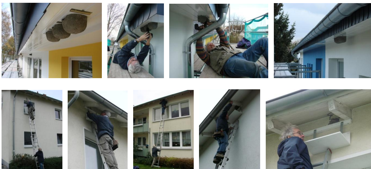
Auffallend viele Bielefelder Mehlschwalben haben sich Wohnsiedlungen mit Mehrfamilienhäusern als Koloniestandorte gewählt. Oft kommen auch Mauersegler und Spatzen in diesen Siedlungen noch zahlreich vor. BGW und NABU arbeiten nun zusammen, um die Quartiere der Gebäudebrüter bei Sanierungsmaßnahmen zu erhalten oder zu ersetzen.